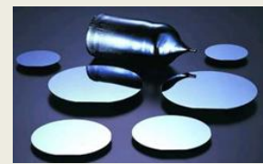
ガリウム砒素基板