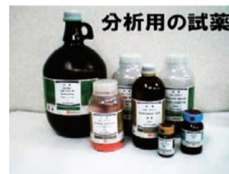
分析機器・器具・測定用の器材 から薬品まで全てお任せ