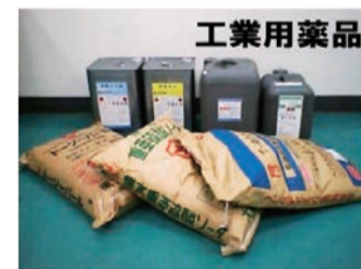
洗浄用の有機溶剤・ メッキ用薬品、排水処理用薬品

当社は、秋田県内を主力基盤として、体外検査診断薬とこれらの分析 機器類の卸販売、工業用薬品類の販売、県内の大学・研究機関への研究用 試薬・器材の販売、および医療廃棄物の収集等を行っております。